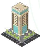
AMMINISTRATORI DI CONDOMINIO