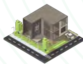
STUDI DI PROGETTAZIONE